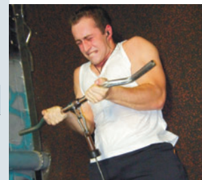
Bester Kumpel: Trainingspartner Dixi